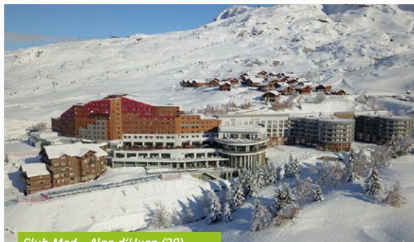
Club Med - Alpe d'Huez (38)

En ce qui concerne la collecte, environ 120 M€ ont été levés par votre SCPI, ce qui représente une hausse très significative par rapport à 2021, et un retour vers les niveaux usuels. C'est un signe de la confiance renouvelée des investisseurs dans les fondamentaux solides du véhicule.